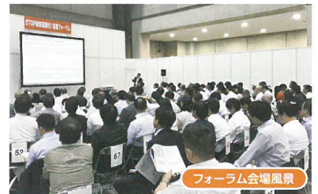
フォーラム会場風景

Mail: forum@nippo-biz.co.jp (問い合わせ専用。メールによる申込受付は行っていません。)